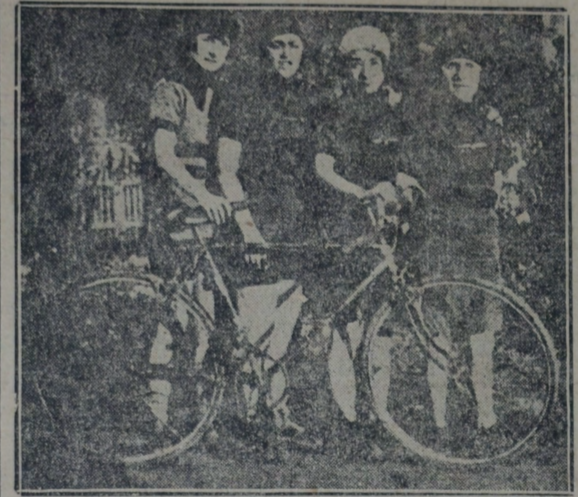
EQUIPO FEMENINO DEL CLUB SPORT IVES, VENCEDOR EN LA CLASIFICACION POR EQUIPOS DE LA PRUEBA CICLISTA

En los alrededores de París tuvo lugar un "cross-country" en bicicleta. La prueba recientemente una interesante prueba tuvo sus alternativas agradables deportivas femeninas consistentes durante el transcurso de su desarrollo.