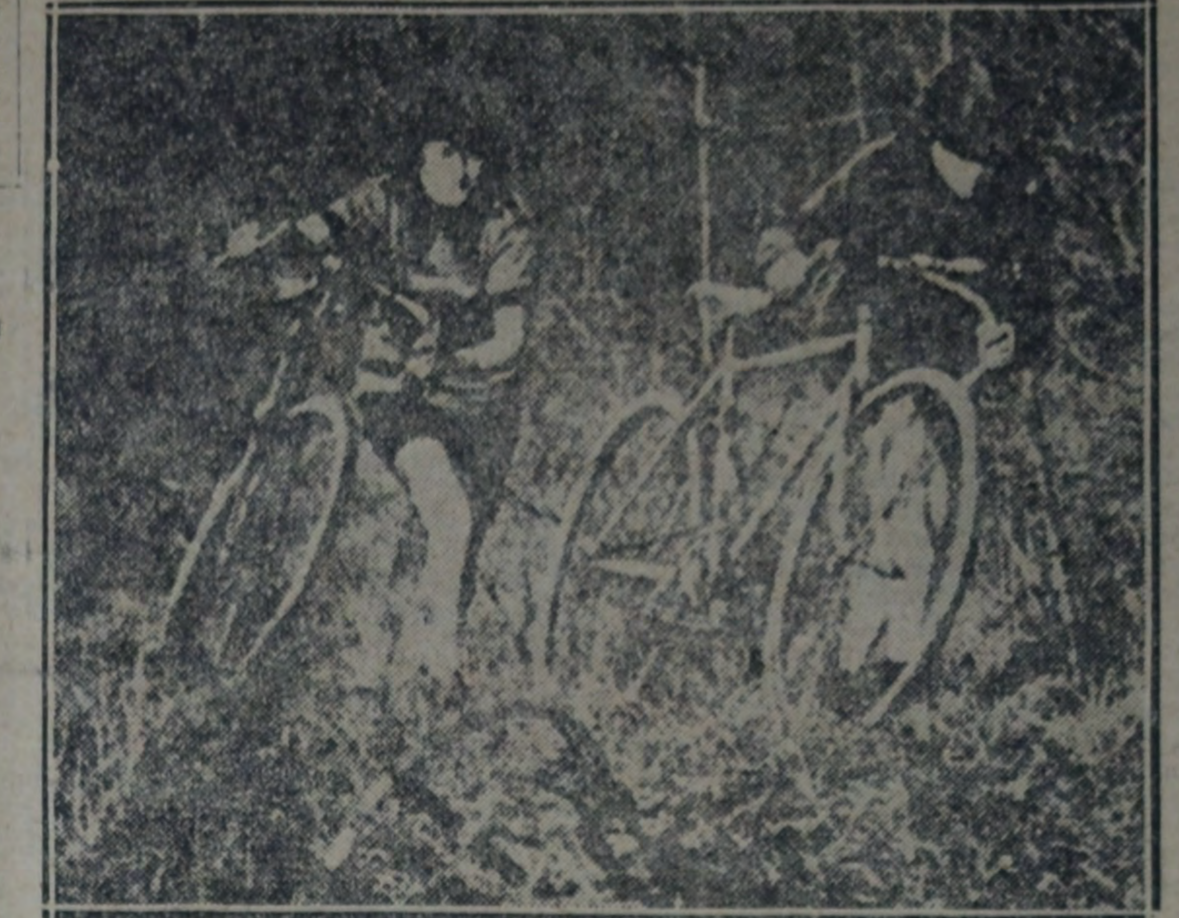
UN ASPECTO DE LAS PARTICIPANTES DURANTE EL DESARROLLO DE LA PRUEBA

A fin de mantener un tren regular, es conveniente que, al efectuarse el ensayo en la pista, éste se realice con la ayuda de un compañero el cual tendrá a su cargo, controlar el tiempo empleado en las vueltas. Al propio tiempo se encargará de advertirle las alternativas de las vueltas y se conseguirá