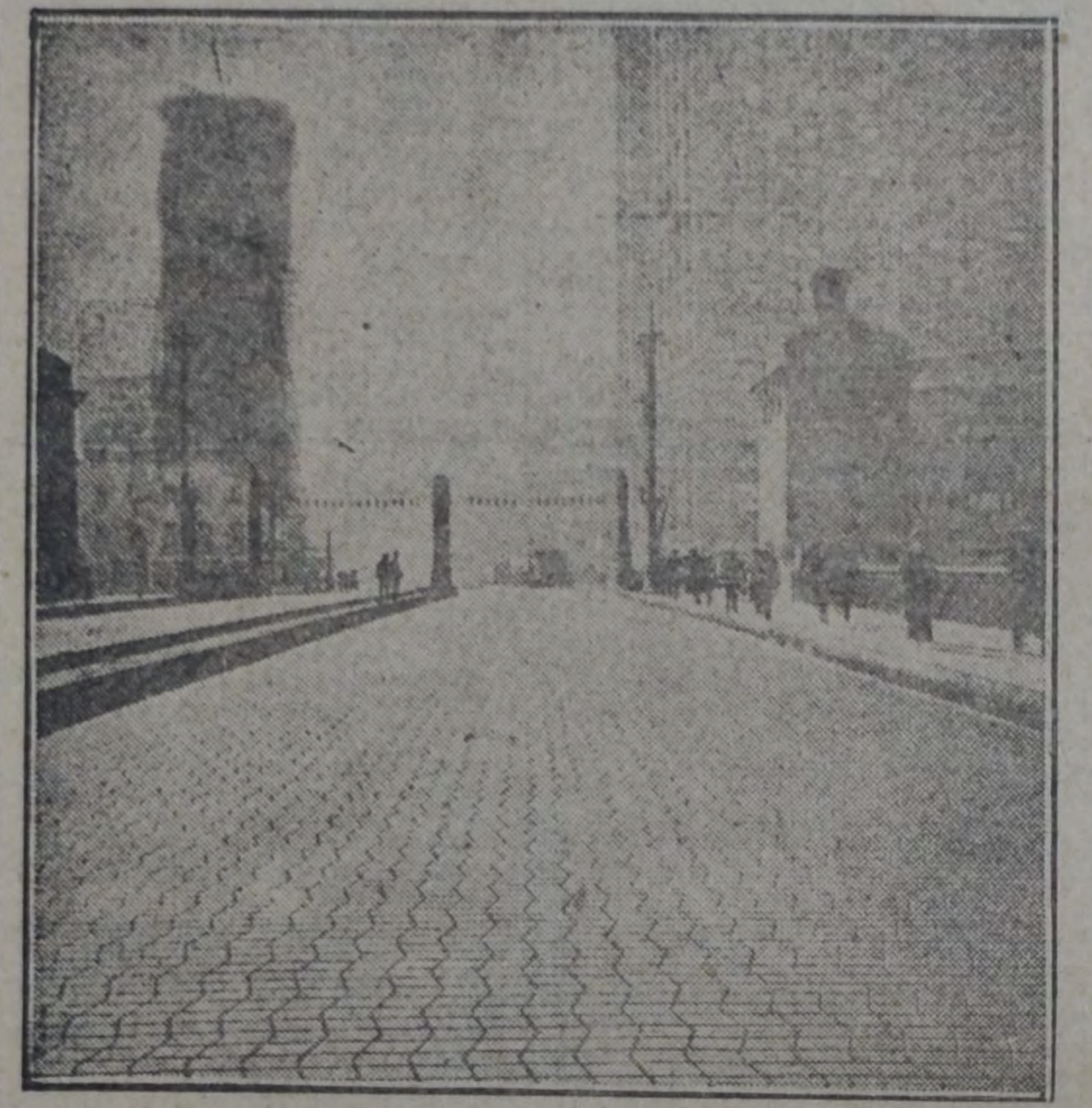
La nueva pavimentación de caucho del puente de la avenida Michigan, en Chicago. Por ese puente pasan diariamente alrededor de 60.000 automóviles. Es la superficie más grande de pavimentación de caucho hecha hasta ahora en los Estados Unidos.

Ocupándose de esta obra, dice "The India Rubber World", de Nueva York.