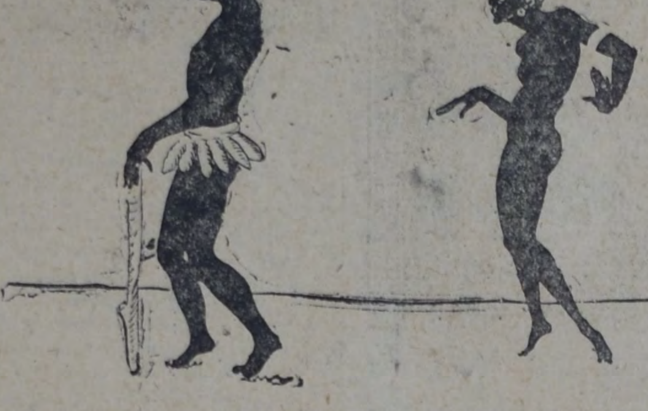
Abuelito, abuelito mío querido, ¿es que ya no quieres a tu pobrecita Rara?

El asunto comenzaba a tomar un carácter penoso y avergonzante... ¿Qué era, pues, lo que quería aquel viejo egoísta? ¿Quería vivir eternamente? ¿O es bía llegado a aquel extremo. Era preciso hablar al anciano testarudo: era imposible que no se inclinase ante las palabras de la razón y de la honradez. Y el padre de Rara le habló: —En realidad, ¿qué es lo que pretendes? — le preguntó — ¿Quieres escapar ante la muerte? Bien sabes que eso es imposible. Tarde o temprano volverá a buscarte. ¿Crees que será una muerte mejor si te ves desgarrado en la selva por una pantera? ¿O será preferible que te pudras como un árbol viejo? ¿O el que te convirtieras en una carga para los demás y para ti mismo, y que una mala enfermedad te aniquile? No, padre mío; tú no puedes desear semejante cosa seriamente. Para tí no hay más que un solo fin digno: morir